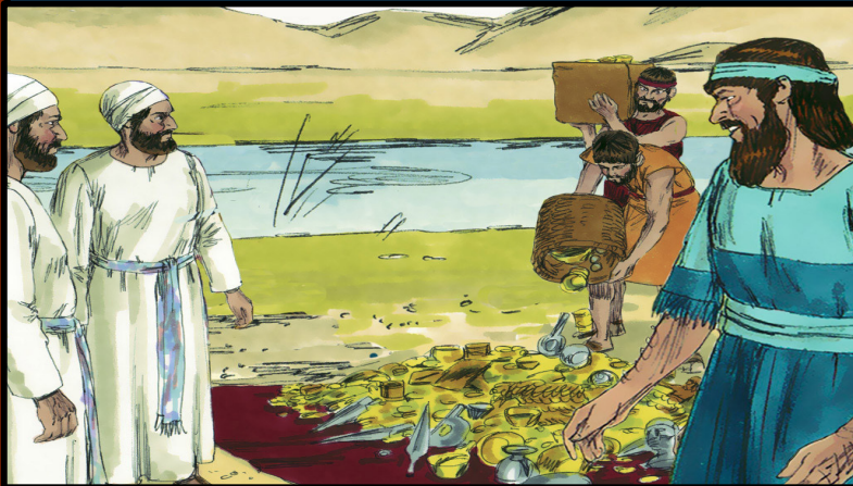
Iniciaron el viaje hacia Jerusalén